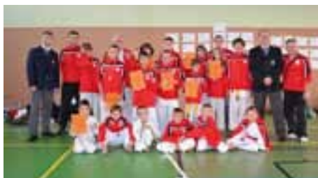
Celý tým na Velké ceně Blovic