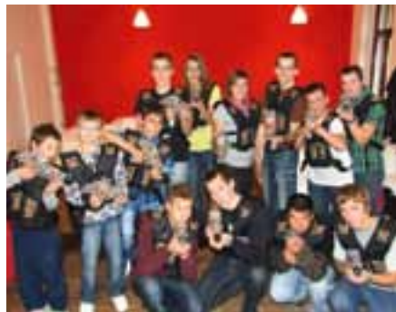
Družstvo starších žáků, „Lasergame“ Praha, 26. října 2012

V říjnu pomalu končila stávající sportovní sezóna, nicméně družstvo mládeže započalo již prvním kolem HRY PLAMEN mládeže pro rok 2013 v Březové (SO) novou sportovní sezónu. Starší žáci obsadili velmi pěkné druhé místo a naše mladší družstvo obsadilo čtvrté místo. Další mládežnická akce byla pojata jako sportovně zábavná pro kolektiv starších. Navštívili zábavné centrum „Lasergame“ v Praze, kde byli rozděleni do dvou družstev pomocí laserových pistolí útočili na domečky druhého družstva. Po té navštívili krátký hororový film v 5D kině a dlouhé filmy ve 3D (Asterix a Obelix ve službách jejího veličenstva, Kozí příběh se syrem a Ve stínu).