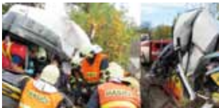
Vyproštění osoby po velmi těžké nehodě nákladního vozidla do stromu, Jenišov, 10. října 2012

Chodovští hasiči v říjnu zasahovali celkem u 18 událostí. Z pohledu náročnosti zásahů, zejména při zranění osob, byl říjen oproti předchozímu období takřka extrémní. Statistiku rozšířily tři požáry, zahošení potravin v bytě 9. patře v ulici U Koupaliště v Chodově, odpad v bývalém pivovaru v K. Varech, elektrospotřebič v bytě v ulici 9. Května v Chodově. Velká pochvala patří chlapci, který zachoval chlanou hlavu při tomto požáru. Po zpozorování požáru provedl hašení spotřebiče pomocí deky, po sražení plamenů provedl vypnutí elektrických pojistek a zbytek dohasil konvicí vody. Ostatní události měly technický charakter. Jednotka zasahovala při úniku plynu v základní škole v Karlových Varech - evakuace cca 500 žáků, také zajistila přistání vrtulníku pro transport těžce zraněné osoby v ulici Vintířovská v Chodově. Celkem jednotka zasahovala u tří dopravních nehod, které si vyžádaly dvě zranění (nehoda dvou osobních automobilů v křižovatce Smetanova - Školní v Chodově, velmi těžká dopravní nehoda nákladního vozidla do stromu s vyproštěním vážně zraněného řidiče na komunikaci u Jenišova, nehoda osobního a nákladního vozidla na křižovatce Vintířov - Důl Jiří - bez zranění).