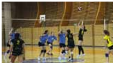
BVC Witte Chodov – Lokomotiva Plzeň