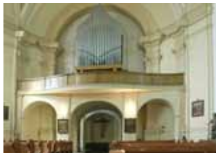
Po odstranění příček