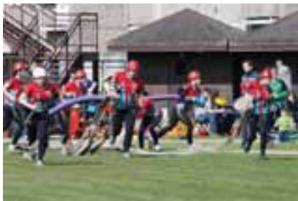
Pohár starosty - ženy, Chodov, 22. dubna 2012

ligy. Chodovští mládežníci vybojovali velmi pěkné čtvrté místo, chodovské ženy byly třetí, mužům se v tento den tolik nedařilo s celkovým desátým místem. Souhrnné výsledky a informace je možné nalézt na www.sdhchodov.cz . Preventivně výchovnou akcí navštívili chodovští hasiči v dětské vesničce SOS v Karlových Varech-Doubí. Ve spolupráci s pořádajícím Krušnohorským spolkem jedné stopy zde byla předvedena naše zásahová cisterna (tzv. jednička), v rámci programu, kde nechyběly další složky IZS, byla pro děti vyrobena hasebná pěna. Další pravidelnou preventivní akcí absolvovali studenti dvou tříd chodovské Obchodní akademie a gymnázia přímo na zbrojnici. V průběhu dubna také chodovští mládežníci získali odznaky odbornosti Strojník, Strojník Junior a Preventista.