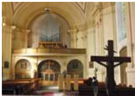
Před odstraněním příček

vedoucí odboru školství, kultury a vnitřních věcí