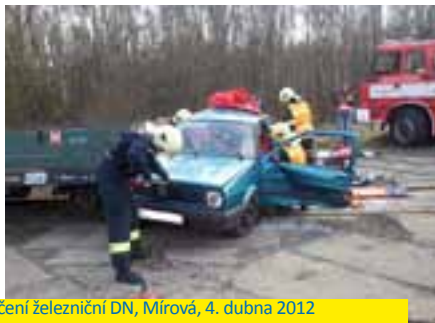
Cvičení železniční DN, Mírová, 4. dubna 2012

V dubnu zasahovali chodovští hasiči celkem u devíti událostí. Z toho byly tři požáry, parapet v Jiráskově ulici při hře dětí s podpalovačem, plastový kontejner v Husově ulici, odpad a tráva u rybníku Račák. Ostatní události měly technický charakter. Jednotka prověřila signál elektrické požární signalizace v novém výrobním objektu Lincoln. Naštěstí nešlo o požár, ale o poruchu na topném systému. Dále byla provedena ve spolupráci s profesionály z Karlových Varů a Sokolova záchrana zraněné osoby ze střechy starší haly Lincolnu. Další záchrana osoby spočívala při vyproštění dítěte, které mělo zaklíněnou ruku mezi podlahou výtahu a ocelovou příčkou výtahových dveří ve Smetanově ulici v Chodově. Taktéž byly likvidovány dva úniky provozních kapalin z vozidel v ulici U Koupaliště a Boženy Němcové v Chodově. V rámci odborné přípravy byli členové jednotky prověřeni při simulované železniční dopravní nehodě v Mírově. Zde byla připravena srážka osobního vozidla a drezíny, ve vozidle cestovalo pět zraněných osob, které museli hasiči vyprostit pomocí hydraulického vyprošťovacího zařízení a poskytnout jim první pomoc.