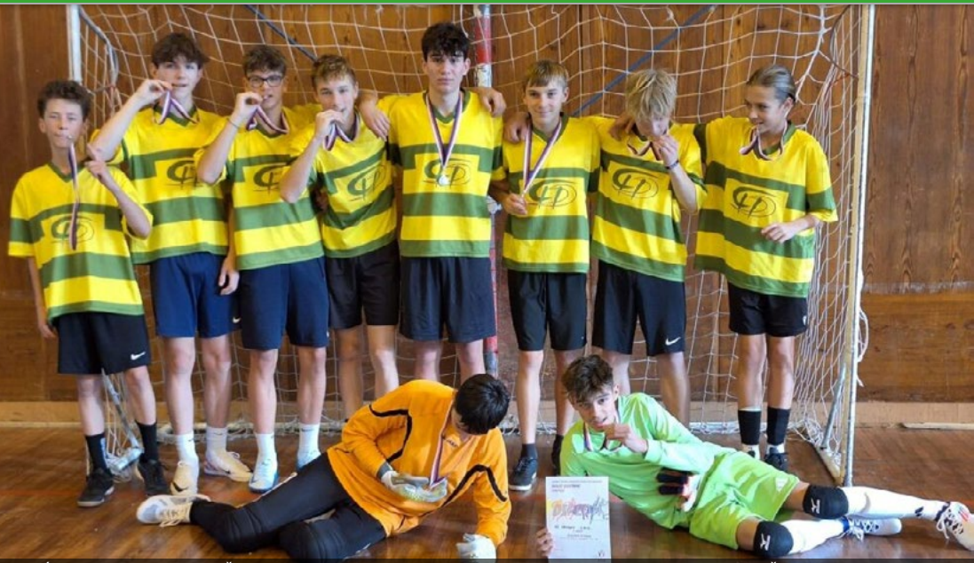
Úspěšný futsalový tým ZŠ J. A. Komenského.