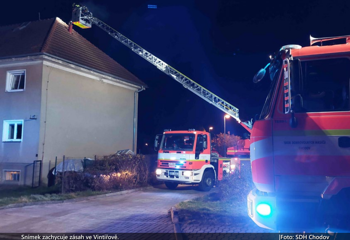
Snímek zachycuje zásah ve Vintířově.