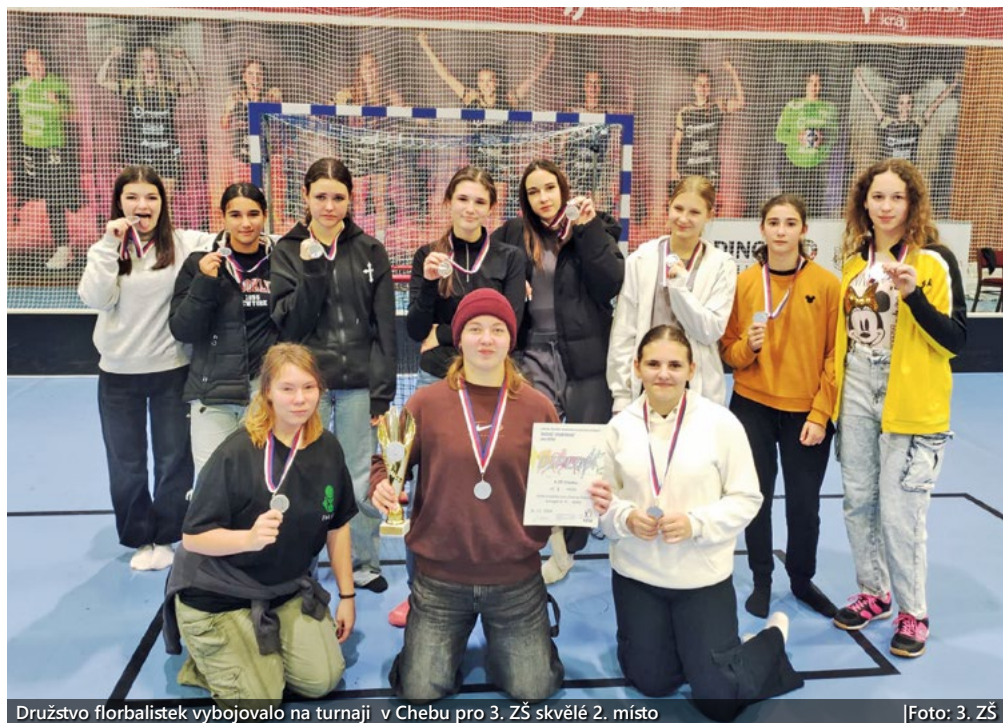
Družstvo florbalistek vybojovalo na turnaji v Chebu pro 3. ZŠ skvělé 2. místo