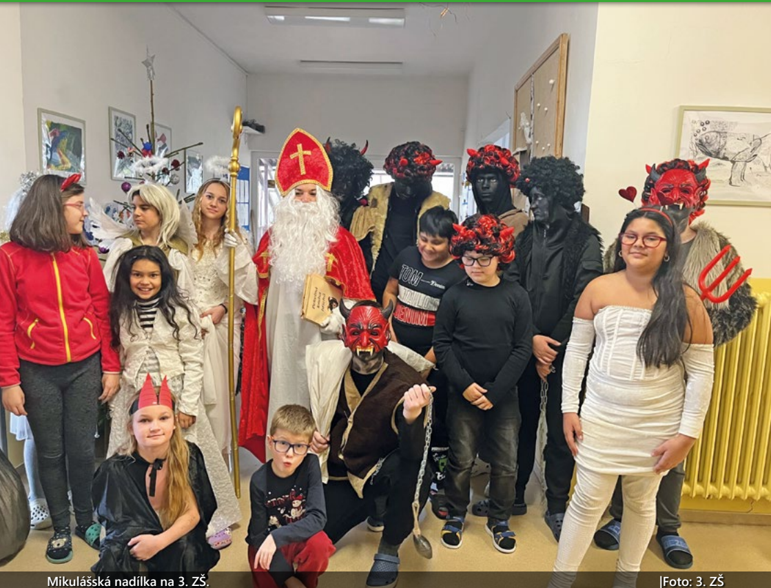
Mikulášská nadílka na 3. ZŠ.