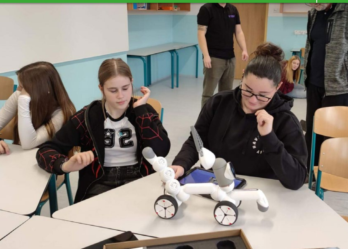
Novou komunitní učebnu v budově 2. stupně ZŠ Školní mohou využívat žáci s učiteli k různým setkáním, besedám i netradiční výuce. Na snímku žáci devátého ročníku a roboti Loona a Clickbot.