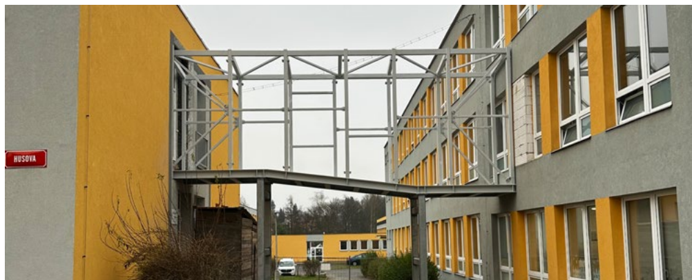
Probíhající rozsáhlá rekonstrukce 3. ZŠ v Husově ulici (na snímku) není ohrožena. I přes očekávaný pokles příjmu do městského rozpočtu patří tato stavba mezi priority Chodova.

Městská kasa se podle něj bude muset od příštího roku obejít bez části peněz z poplatků za výherní hrací automaty, přičemž v minulých letech tato položka činila zhruba 33 milionů. K 30. listopadu 2024 (tedy v prvním roce platnosti konsolidačního balíčku) byl výnos v objemu 16,8 milionu korun, v předcházejícím roce ke stejnému období to bylo 33,2 milionu. Získané peníze město využívá mimo jiné na podporu sportu, kultury a investice. „Vnímáme to jako podraz na města, která si na svém území automaty nechala i přes některé negativní doprovodné jevy. Naopak obce, které hery vytlačily na okraj, na tom nyní budou ve finále stejně, nebo dokonce lépe,“ okomentoval starosta opatření s tím, že Chodov má stále zdravé finance a poměrně silné rezervy. (mák)