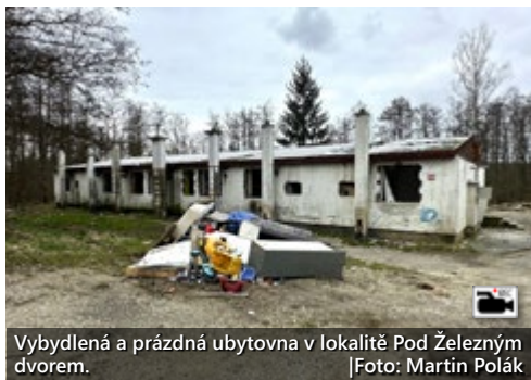
Vybydlená a prázdná ubytovna v lokalitě Pod Železným dvorem.

Na demolici už je vydán výměr a uskutečnit by se měla v průběhu dubna či května. (mák)