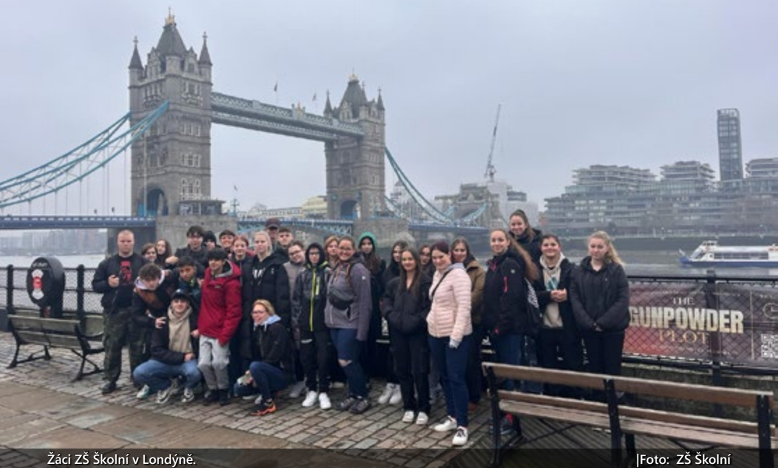
Žáci ZŠ Školní v Londýně.