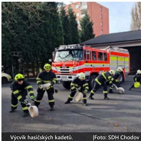
Výcvik hasičských kadetů.