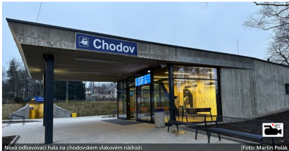
Nová odbavovací hala na chodovském vlakovém nádraží.

Stavba moderního objektu, který je nyní blíž k městu, začala v listopadu roku 2022 a trvala více než jeden rok. (mák)