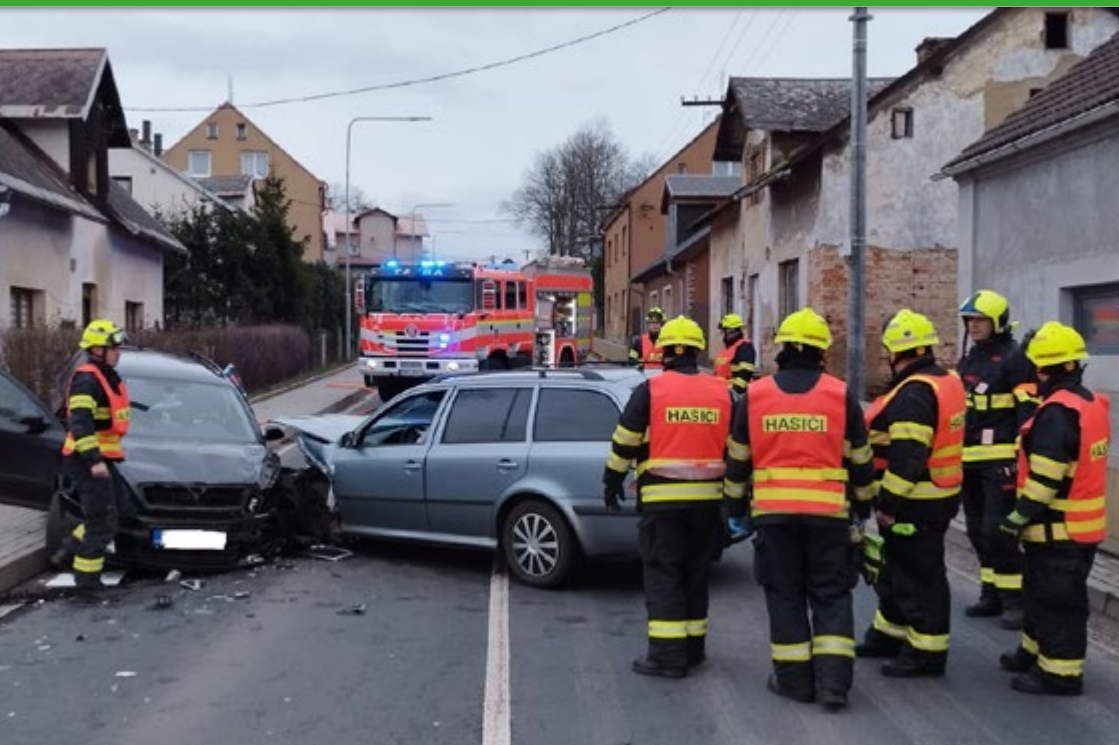
Chodovští hasiči při zásahu u dopravní nehody v sousedním Chranišově.