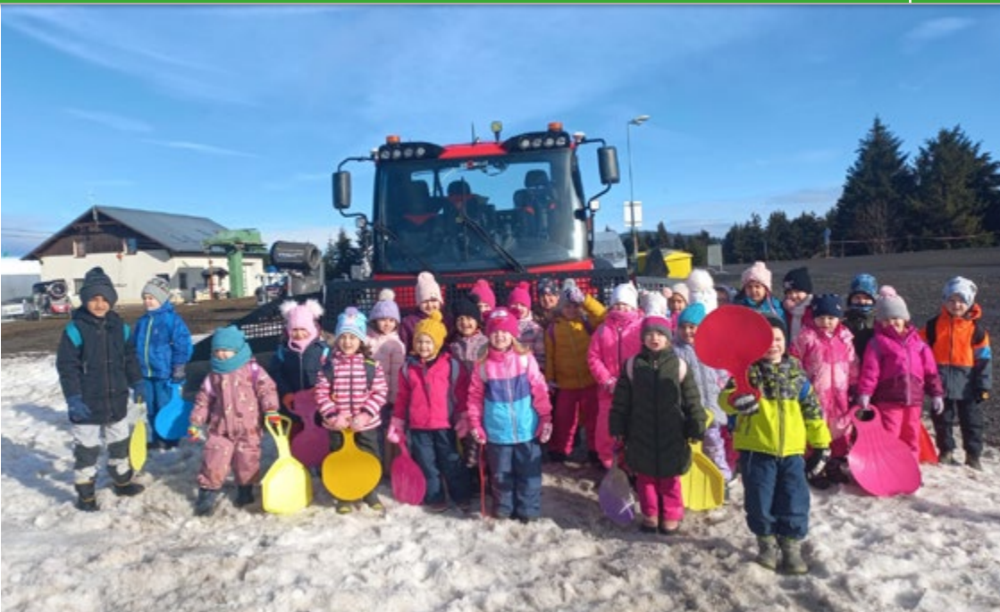
Děti z MŠ U Koupaliště na výletě v Krušných horách.