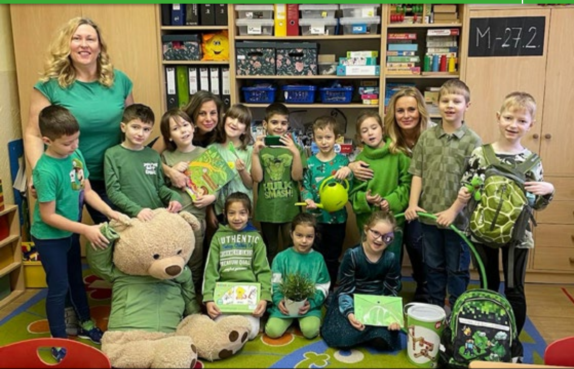
Tradiční barevný týden, tentokrát v barvě „žabičkové“ zelené.