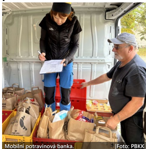
Mobilní potravinová banka.