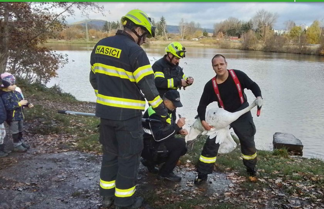
Chodovští hasiči si do statistik mohou zapsat další záchranu zvířete. Na rybníku Bahňák tentokrát vysvobodili ze zajetí rybářských vlasců labuť.

dvou osobních vozidel v Děpoltovicích, bez zranění se obešla nehoda osobního vozidla v příkopu poblíž Lignety. Během návratu ze služební cesty s velitelským vozidlem jednotka zasahovala u dopravní nehody tří osobních vozidel na hlavním pražském tahu u křižovatky na Nesuchyně. Nehoda si vyžádala zranění dvou osob, členové jednotky zabezpečili místo, povolali přes 112 všechny záchranné složky, postarali se o zraněné osoby a provedli protipožární jistiění do příjezdu místních složek IZS, poté pokračovali dál na základnu. Ve dvou případech bylo provedeno nouzové otevření bytu při obavách o užívání bytu, nakonec bez zranění (Osadní a Bezručova).