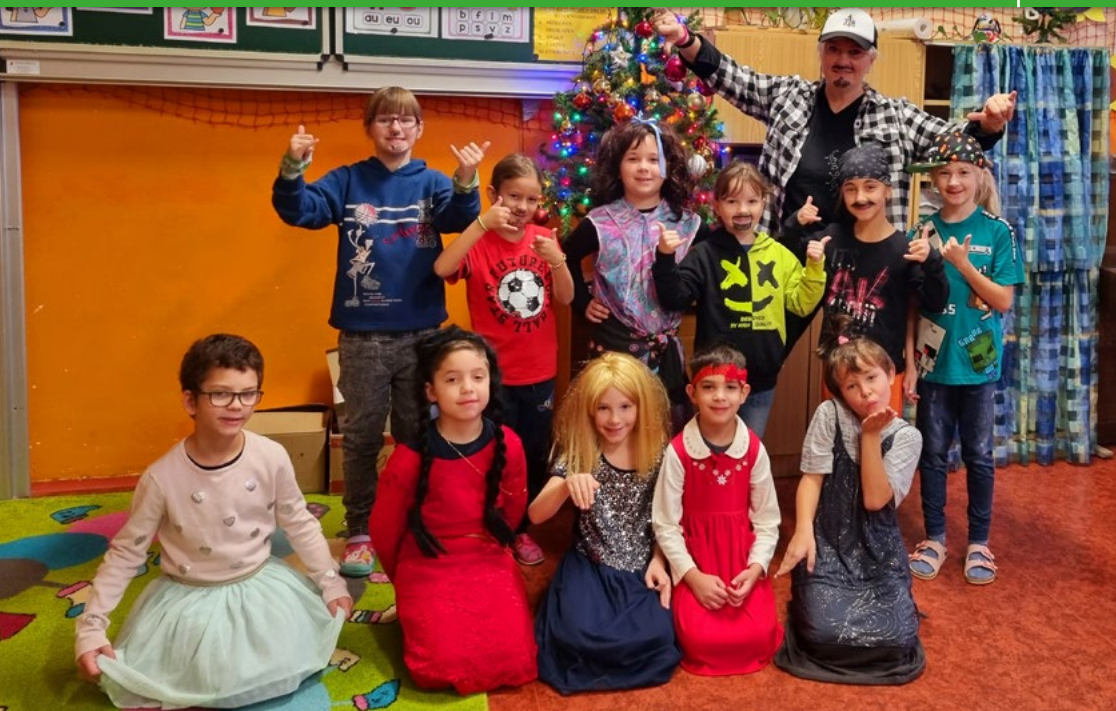
Jedním z úkolů adventního kalendáře byla také výměna rolí – děvčata se převlékla za kluky a naopak.

proměnily na tvořivé dílny. Starší žáci se do tvoření zapojili samostatně, bez pomoci rodičů.