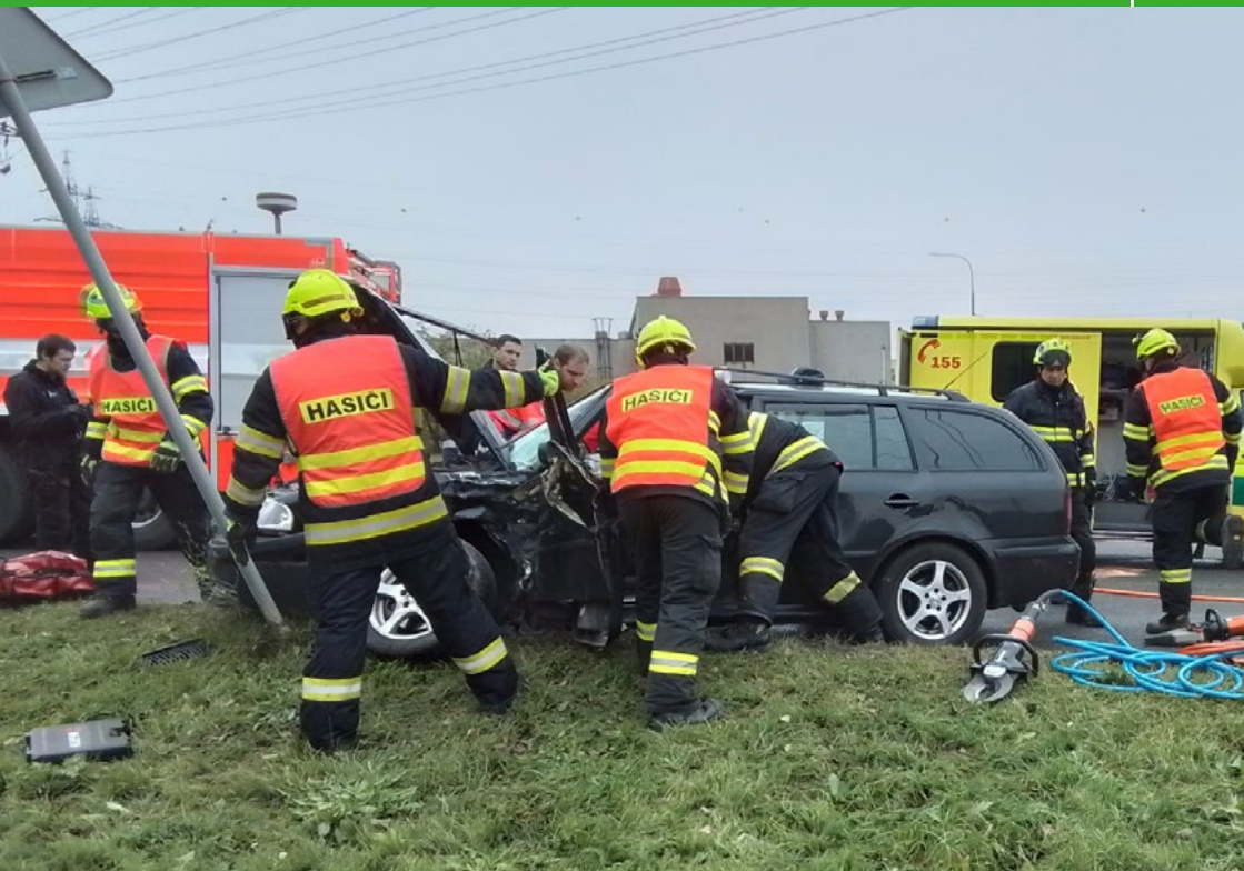
Hasiči při zásahu u dopravní nehody ve Vintřově.