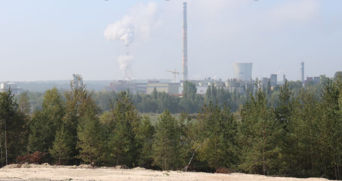
Podnik Sokolovské uhelné ve Vřesové.