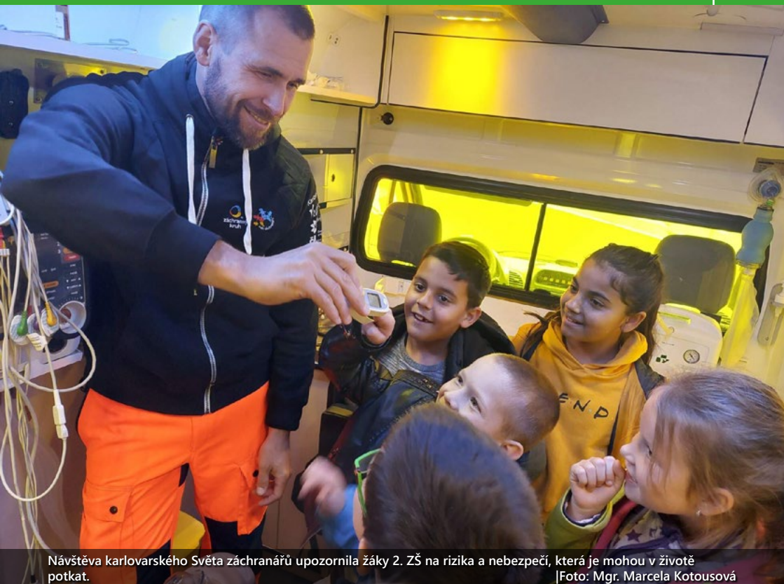
Návštěva karlovarského Světa záchranářů upozornila žáky 2. ZŠ na rizika a nebezpečí, která je mohou v životě potkat.