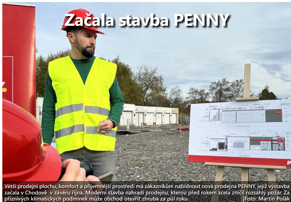
Větší prodejní plochu, komfort a příjemnější prostředí má zákazníkům nabídnout nová prodejna PENNY, jejíž výstavba začala v Chodově v závěru října. Moderní stavba nahradí prodejnu, kterou před rokem zcela zničil rozsáhlý požár. Za příznivých klimatických podmínek může obchod otevřít zhruba za půl roku.

Infocentrum Sokolov, 5. května 655, Sokolov