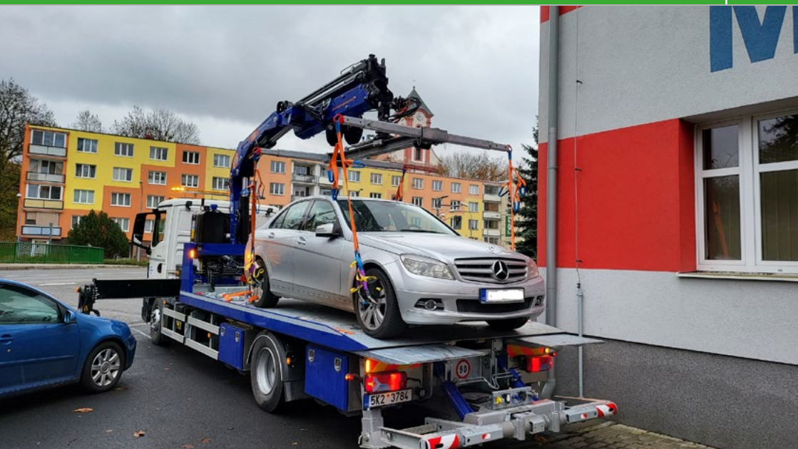
Posádka chodovské odtahové služby už má za sebou první výjezdy.