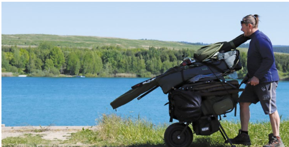
Vítězem letošního hlasování se stal umělý ostrůvek na Bílé vodě, která je vyhledávanou lokalitou nejen sportovců, ale také rybářů a milovníků relaxu.

Druhý ročník participativního rozpočtu města Chodova má i letos vítězné projekty, které budou realizovány v průběhu příštího roku. Maximální částka, do níž se musí každý z nápadů obyvatel Chodova podle nastavených pravidel vejít, je 500 000 korun. Celkově v součtu je pak suma vyčleněná v rozpočtu města pro jejich realizaci dva miliony korun.