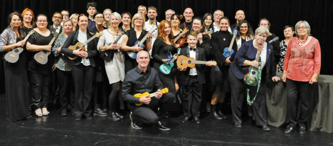
Chodovské hudební uskupení LeLeBAND.