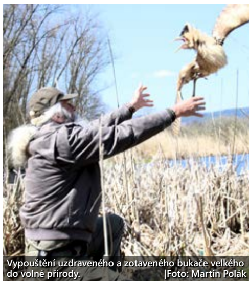
Vypouštění uzdraveného a zotaveného bukače velkého do volné přírody.

Několik let předtím si zase převzala čápa, který se v Chodově vážně poranil na komíně v areálu bývalého Drobného zboží. (mák)