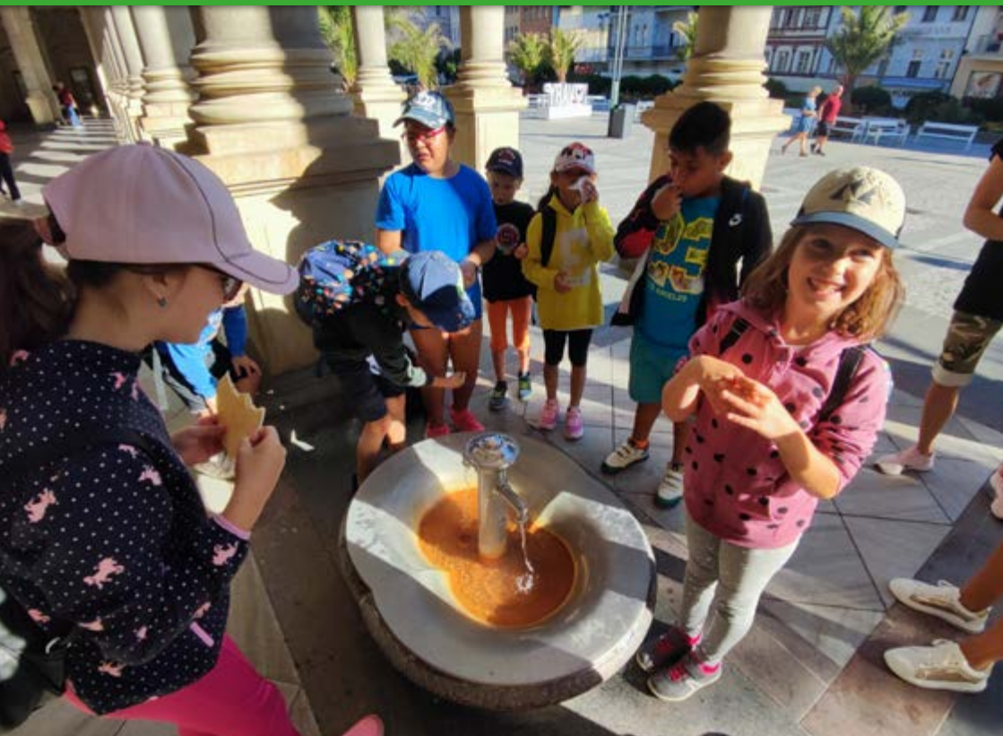
Žáci 3. ZŠ Chodov u karlovarských léčebných pramenů.