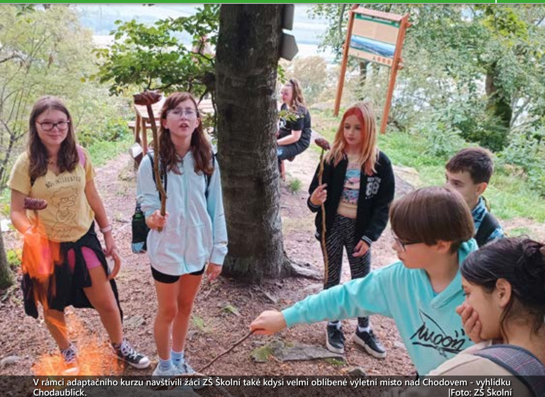
V rámci adaptačního kurzu navštívili žáci ZŠ Školní také kdysi velmi oblíbené výletní místo nad Chodovem - vyhlídka Chodaublick.