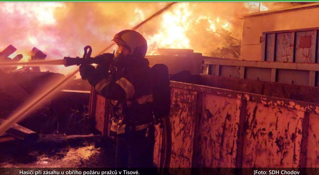
Hasiči při zásahu u obřího požáru pražců v Tisové.