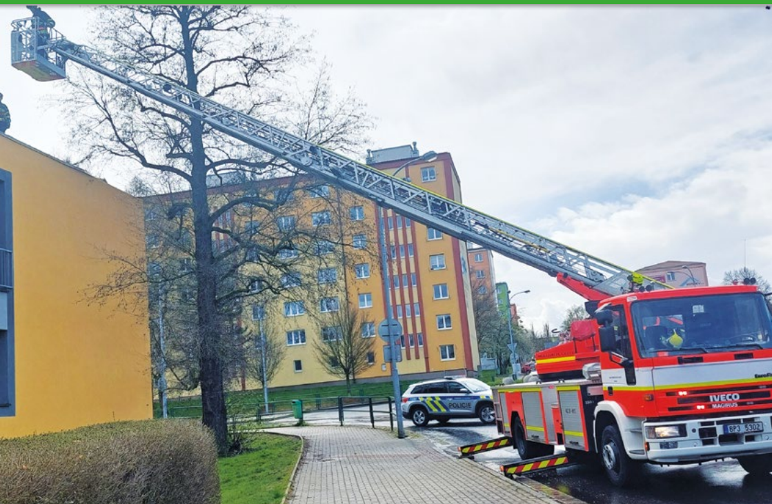
Zásah hasičů u poškozené střechy Spolkového domu.