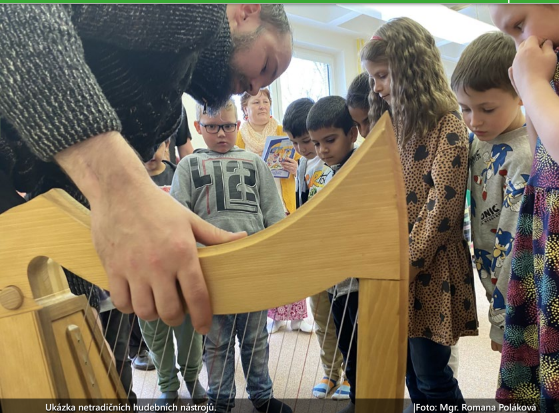
Ukázka netradičních hudebních nástrojů.