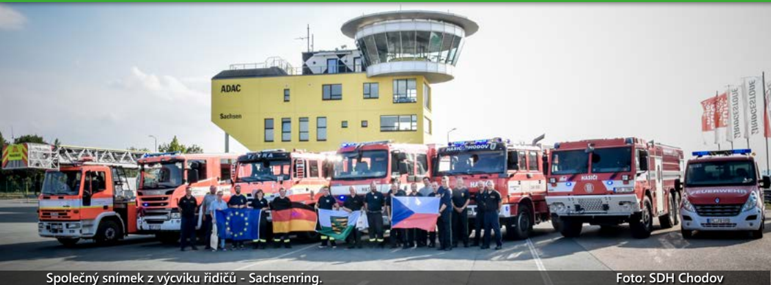
Společný snímek z výcviku řidičů - Sachsenring.