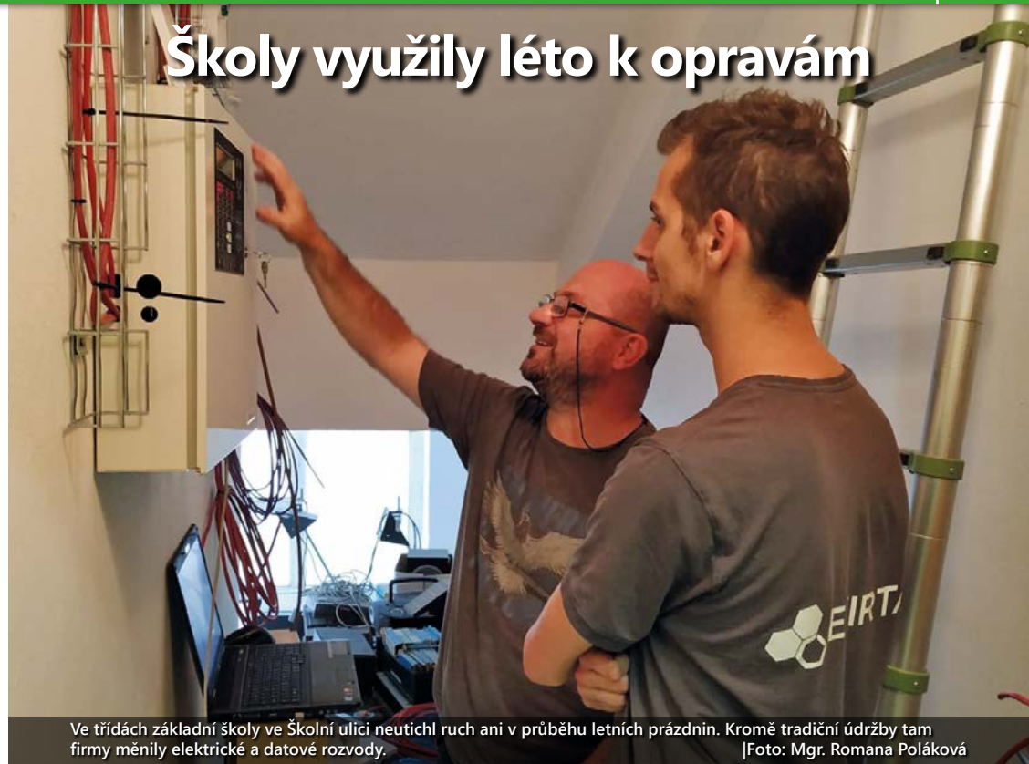
Ve třídách základní školy ve Školní ulici neutichl ruch ani v průběhu letních prázdnin. Kromě tradiční údržby tam firmy měnily elektrické a datové rozvody.