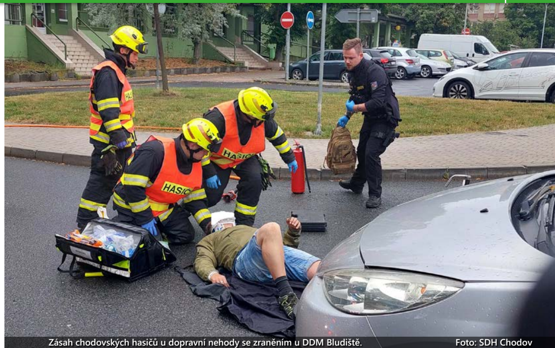
Zásah chodovských hasičů u dopravní nehody se zraněním u DDM Bludiště.