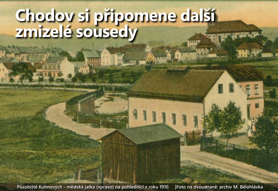
Působíště Kohnových - městská jatka (vpravo) na pohlednici z roku 1910.

V polovině července se do Chodova alespoň symbolicky vrátili čtyři jeho bývalí obyvatelé. Poštou totiž z Německa přišly letošní kameny zmizelých – stolpersteine –, které jsou pokládány u domů, kde do druhé světové války žili naši sousedé zavraždění během holokaustu.