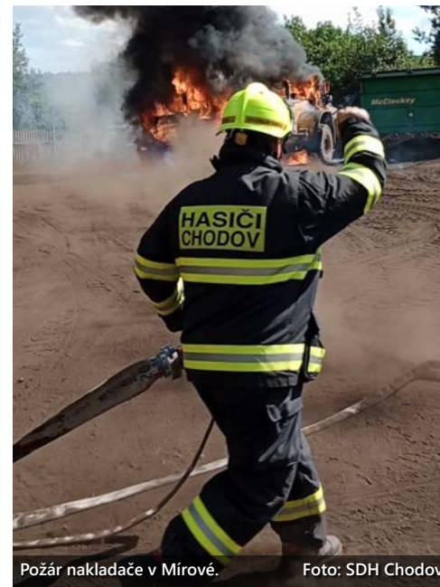
Požár nakladače v Mírově.

Velké poděkování patří všem členům naší jednotky za náročnou práci i v prázdninových měsících. Další informace včetně bohaté fotogalerie naleznete na našem webu či facebooku