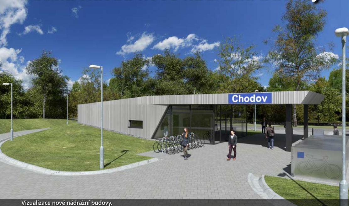
Vizualizace nové nádražní budovy.

Správa železnic uzavřela smlouvu na novostavbu výpravní budovy ve stanici Chodov na Karlovarsku. Stavební práce provede za cenu 34,5 milionu korun společnost STRABAG Rail. Nová budova bude umístěna nedaleko vstupu do podchodu, vybudovaného v rámci modernizace nástupišť. Na místě současného nádraží vznikne točna a stání pro autobusy. Stavba bude navržena ke spolufinancování z Nástroje pro oživení a odolnost (RRF) Evropské unie. Práce měly začít v průběhu srpna, jejich dokončení se předpokládá v říjnu příštího roku.