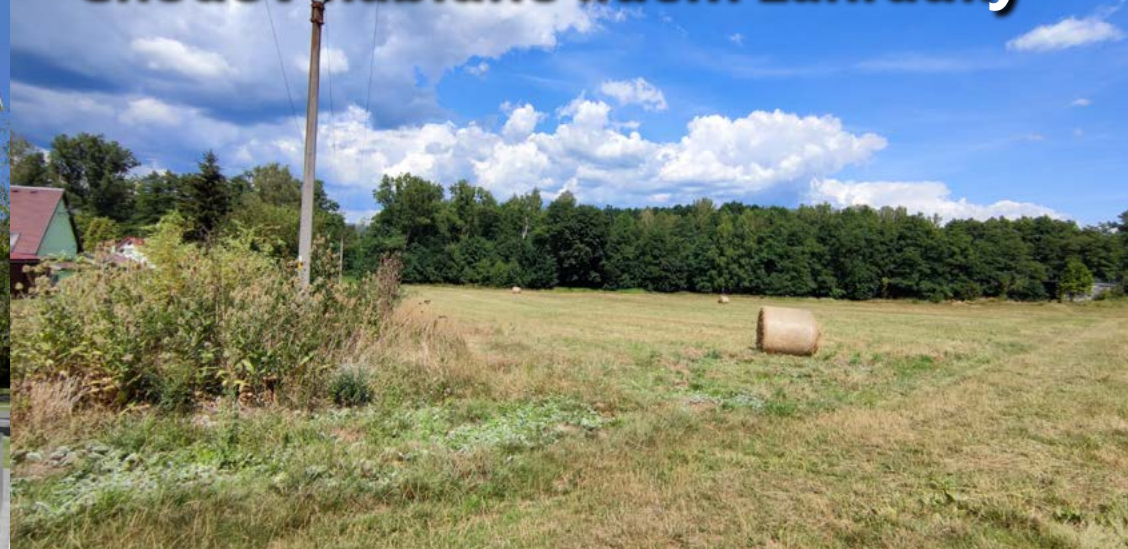
Místo, kde chodovská radnice plánuje vznik nové zahrádkářské kolonie.